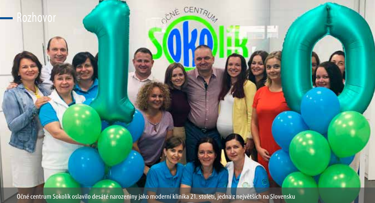
Očné centrum Sokolík oslavilo desáté narozeniny jako moderní klinika 21. století, jedna z největších na Slovensku